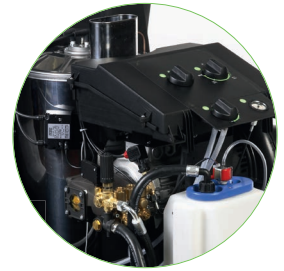
Leichter Zugang für Wartungsarbeiten