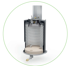
Brenner mit Edelstahlgehäuse