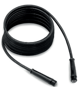
8m Hochdruckschlauch 3.8007.TBAP28305