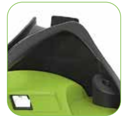
Kopf mit Kabelhaken