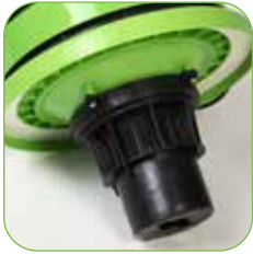
Kopf mit Schaumhemmsystem