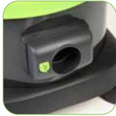
Behälter aus extrem stoßfestem, verschleißfestem und leicht zu reinigendem Polypropylen