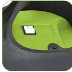
Kunststoffteile aus hochfestem und vollständig recycelbarem Polypropylen