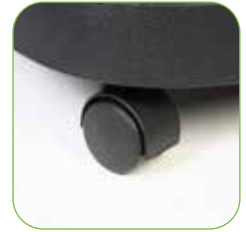
Mit selbstlenkenden Rädern, um eine leichte Beförderung zu garantieren