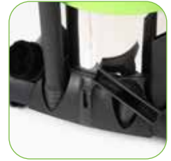
mit hinterem Fahrgestell als Zubehörablage