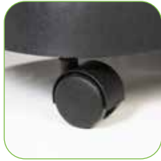
mit selbstlenkenden Rädern, um eine leichte Beförderung zu garantieren