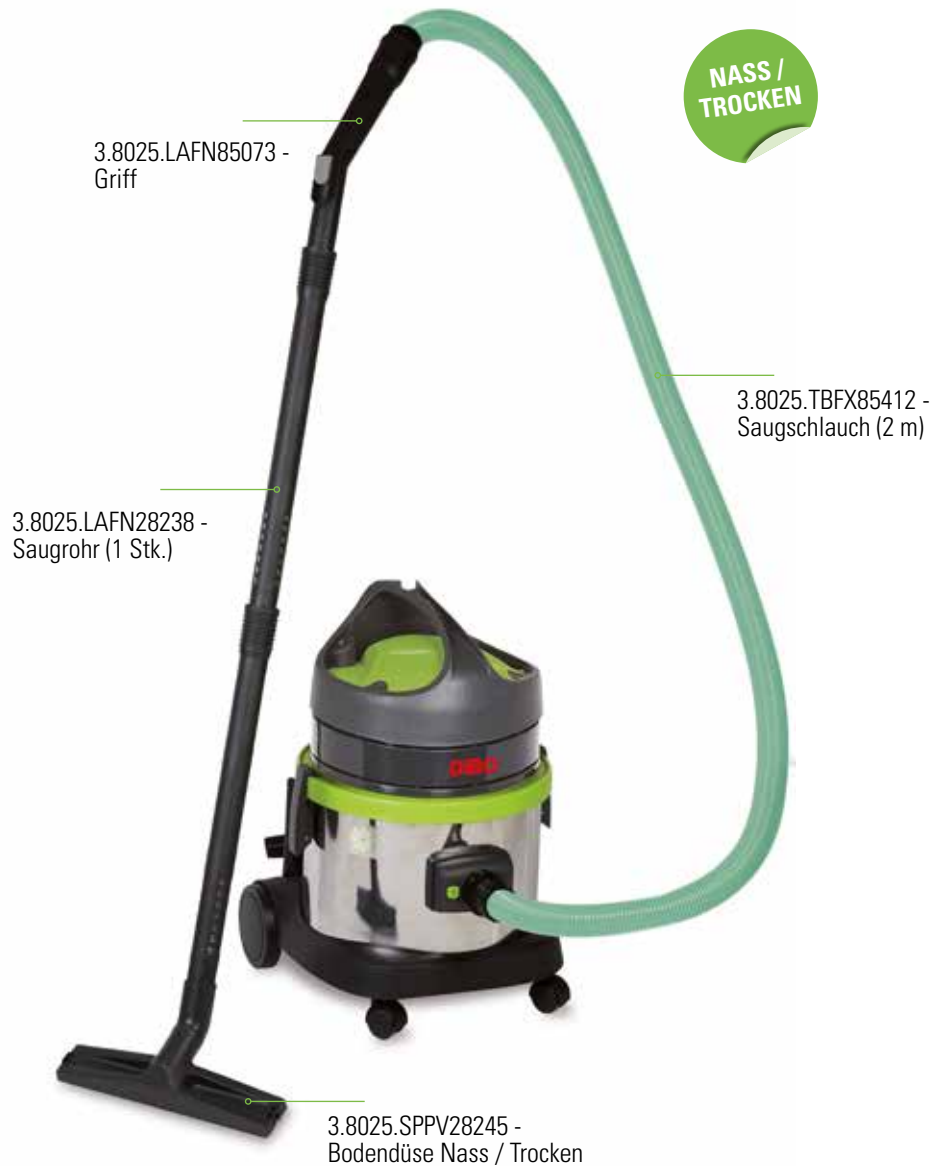
3.8025.LAFN85073 - Griff