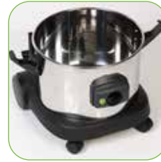
Robuster Behälter aus Stahl