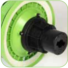
Kopf mit Schaumhemmsystem