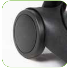
Fahrgestell mit groß bemessenen Hinterrädern, für eine bessere Lenkbarkeit