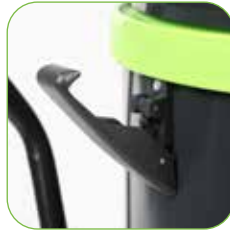
Kunststoffteile aus hochfestem und vollständig recycelbarem Polypropylen