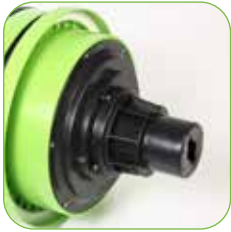
Kopf mit Schaumhemmsystem