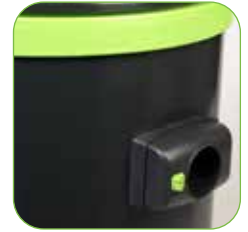
Behälter aus extrem stoßfestem, verschleißfestem und leicht zu reinigendem Polypropylen