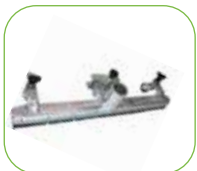
Montierbare Saugdüse zum Staubsaugen