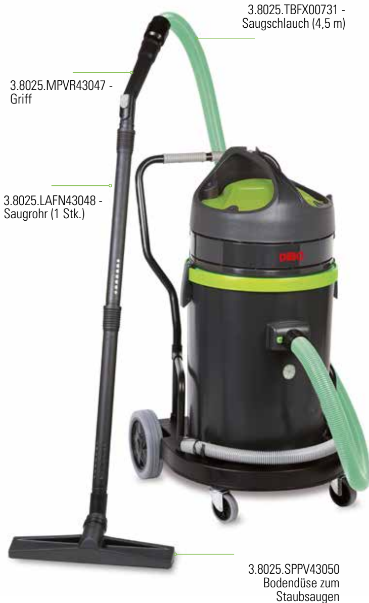
3.8025.TBFX00731 - Saugschlauch (4,5 m)