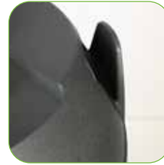
Kopf mit Kabelhaken