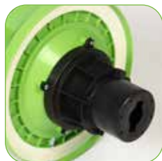
Kopf mit Schaumhemmsystem