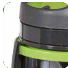
Kunststoffteile aus recycelbarem stoßfestem Polypropylen