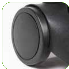
Fahrgestell mit groß bemessenen Hinterrädern, für eine bessere Lenkbarkeit