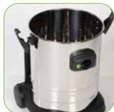
Robuster Behälter aus Edelstahl