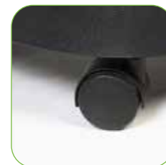
Mit selbstlenkenden Rädern, um eine leichte Beförderung zu garantieren