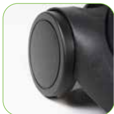
Fahrgestell mit groß bemessenen Hinterrädern, für eine bessere Lenkbarkeit