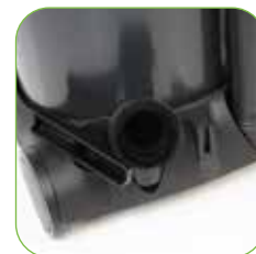
Mit hinterem Fahrgestell als Zubehörablage