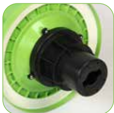
Kopf mit Schaumhemmsystem