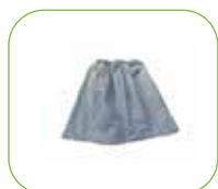
Vorfilter PCB Art.-Nr.: 3.8025.FTDP00222