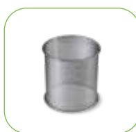
Anti-Schaum Filter Art.-Nr.: 3.8025.FTDP28755