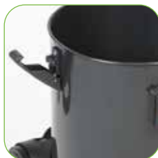
Kunststoffteile aus hochfestem und vollständig recycelbarem Polypropylen