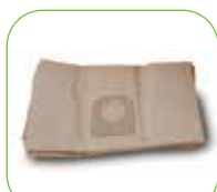
Papierfilter Art.-Nr.: 3.8025.FTDP00221 (5 Stk.)