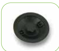
Klemmring-zur Filterbefestigung Art.-Nr.: 3.8025.MPVR28723