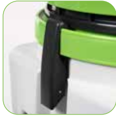
Extrem stoßfester „Compact“ Kunststoffbehälter, resistent gegenüber leicht sauren Substanzen