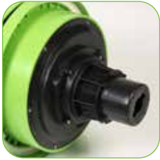
Kopf mit Schaumhemmsystem