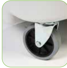
Fahrgestell mit groß dimensionierten Gummirädern für eine gute Manövrierfähigkeit