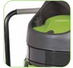
Spezieller Griff für ein leichtes Manövrieren